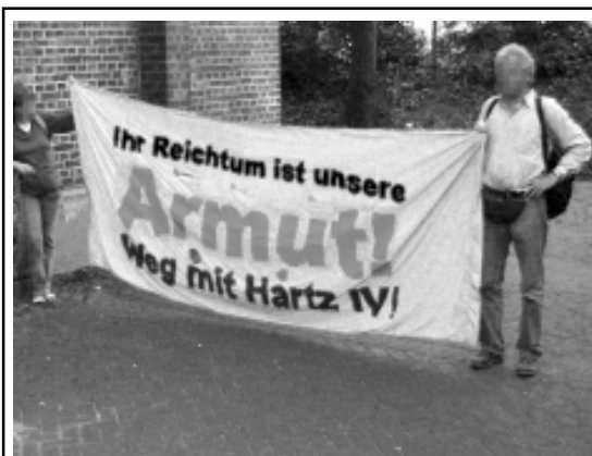
Aktion an der St.Pauli-Kirche: „Ihr Reichtum ist unsere Armut! Weg mit Hartz IV“