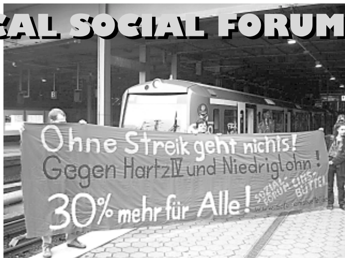
Aktion unseres Sozialforums beim Lokführer-Streik: „Ohne Streik geht nichts! Gegen HartzIV und Niedriglohn - 30% mehr für alle!“

Mach mit, damit wir noch mehr machen können!